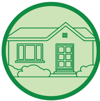
နေမကောင်းလျှင် အိမ်၌နေပါ။ စစ်ဆေးမှု ခံယူပါ