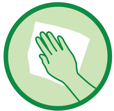
မျက်နှာပြင်များကို ပုံမှန် သန့်ရှင်းပေးပါ