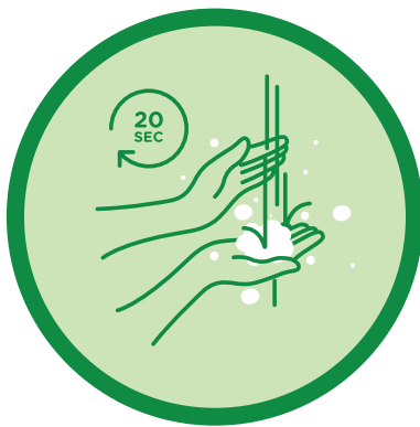
လက်များကို ဆပ်ပြာနှင့်ရေဖြင့် ပုံမှန် ဆေးကြောပါ