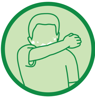
သင့်လက်မောင်းထဲ ချောင်းဆိုးပါ သို့မဟုတ် နှာချေပါ