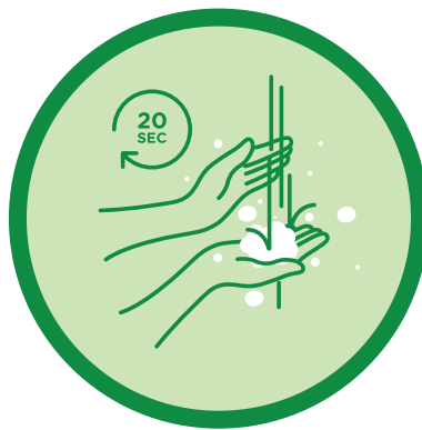
비누와 물로 손을 규칙적으로 씻기