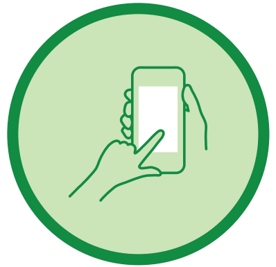
COVIDSAFE ആപ്പ് ഡൗൺലോഡ് ചെയ്യുക