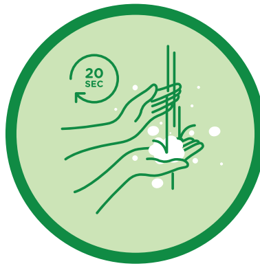
ਸਾਬਣ ਅਤੇ ਪਾਣੀ ਨਾਲ ਹੱਥਾਂ ਨੂੰ ਨਿਯਮਤ ਰੂਪ ਵਿੱਚ ਧੋਵੋ